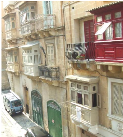
ホームステイ外観