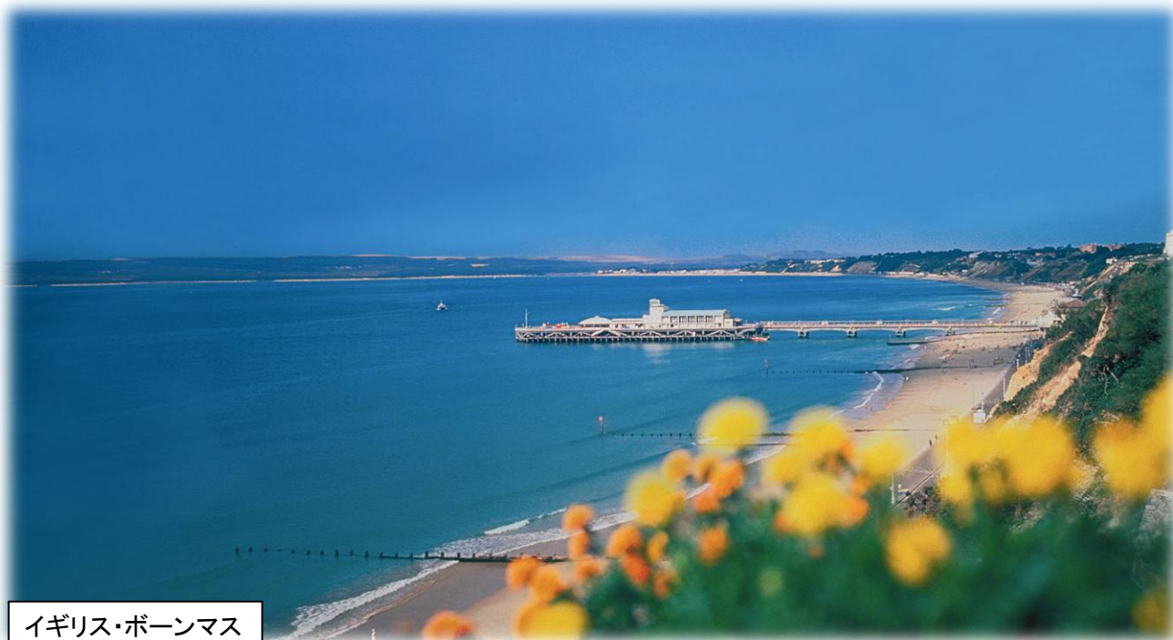
イギリス・ポーンマス